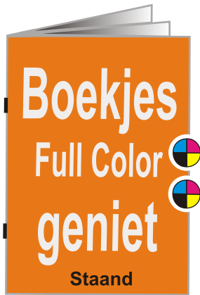
Voorbeeld A5 formaat boekjes